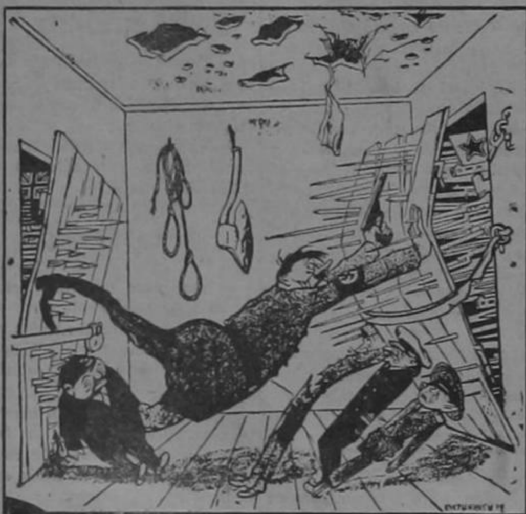
Una situación crítica

Si los hombres no se tuvieran fe unos a los otros, todos deberíamos ajustarnos a nuestros ingresos para vivir.